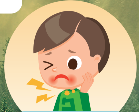
のどのイガイガなど 口腔症状